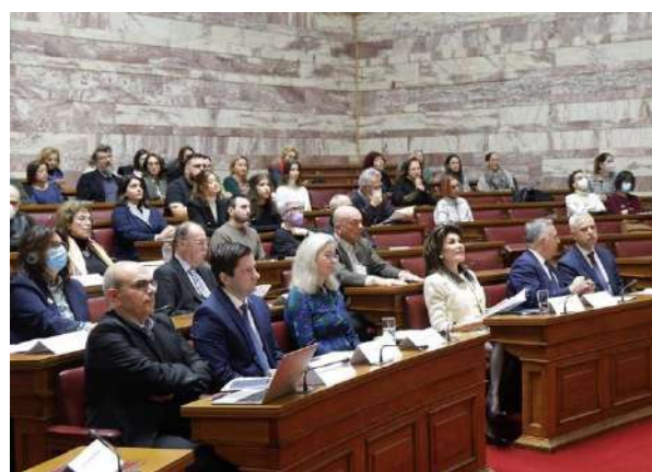
Συνεδροί και κοινό, «Πρώτη Σελίδα: Η Ελληνική Επανάσταση στον Διεθνή και Εγχώριο Τύπο», Αίθουσα Γερουσίας, Βουλή των Ελλήνων

νο χώρο, από το 1821 μέχρι το 1832, δηλαδή 1.770 ξεχωριστά τεύχη, 8.300 σελίδες, πάνω από 30.000 διαφορετικά δημοσιεύματα (ειδήσεις, ειδησάρια, άρθρα, επιστολές, ανακοινώσεις, επίσημα έγγραφα). Έχουν, επίσης, αποδελτιωθεί (για ό,τι αφορά την Ελληνική Επανάσταση) η επίσημη εφημερίδα των Ιονίων Νήσων που κυκλοφορούσε στα Επτάνησα και η εφημερίδα Times του Λονδίνου.